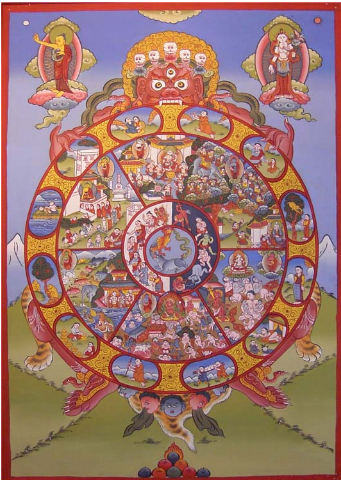
Abbildung 2 Ein Symbol der Wiedergeburt ist das Rad des Lebens - buddhistische Zeichnung aus Bhutan 67

Mittlerweile gibt es hier in Deutschland über hundert buddhistische Gruppen, die Schätzungen zufolge rund 100.000 Menschen vertreten, Buddhisten asiatischer Abstammung nicht mitgerechnet. Eine rasante Entwicklung, wenn man bedenkt, dass bis vor etwa hundert Jahren die buddhistischen Lehrtexte nur einigen wenigen Gelehrten bekannt waren.