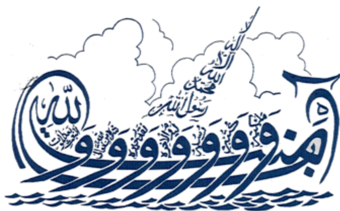
Abbildung 1 (Kalligraphie) 56 : Galeere des Glaubens: in arabischer Schrift: